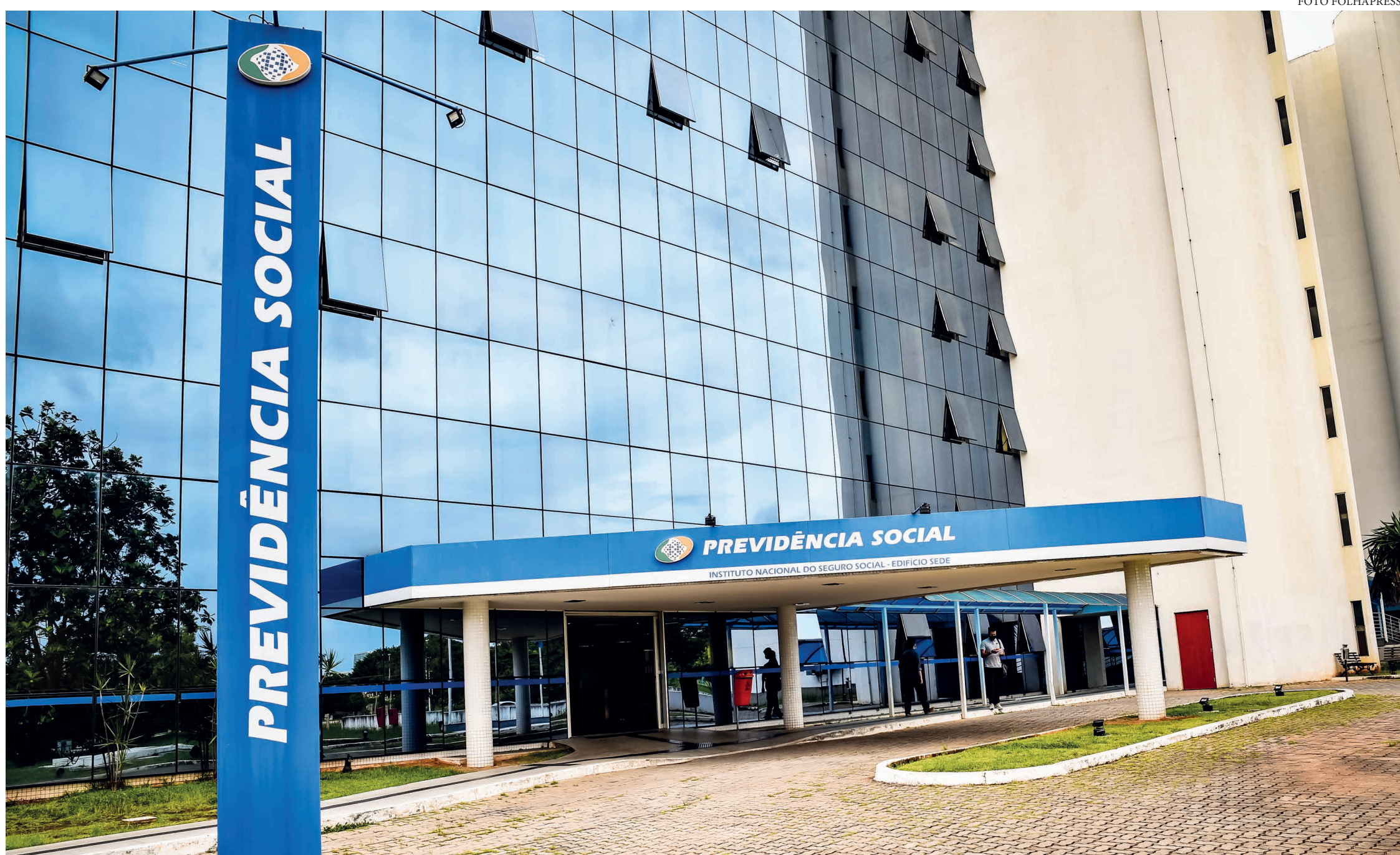
A maior economia, estimada em R$ 7,3 bilhões, será gerada pelo Instituto Nacional do Seguro Social (INSS). A principal medida é um sistema online que substitui a perícia presencial