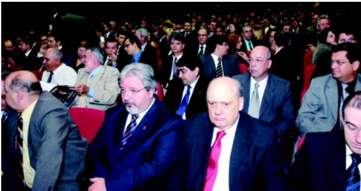
Dirigentes das entidades contábeis e presidentes de Juntas Comerciais de todo o Brasil assistem ao seminário: A ação contábil como diferencial na implantação da Lei Geral, na sede do CFC

união da classe contábil brasileira para trabalhar em prol da implantação da Lei Geral da Micro e Pequena Empresa”, afirmou a presidente do CFC.