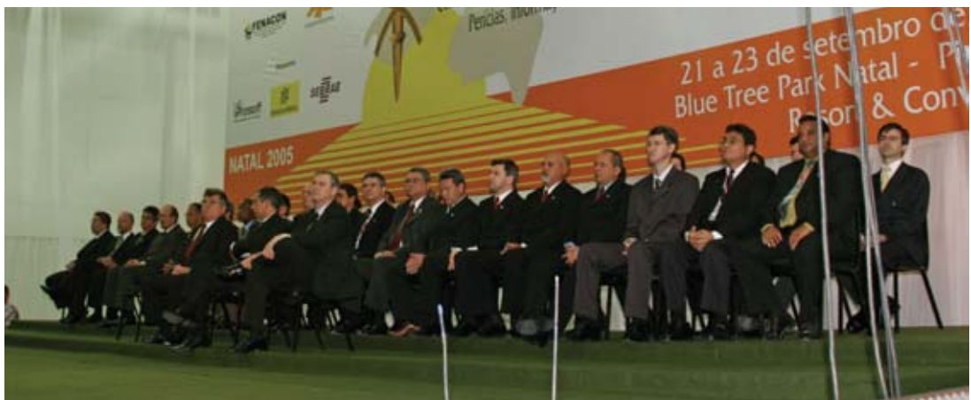
Presidentes dos Sescons e Sescaps e ex-presidentes da Fenacon

Durante a solenidade, os presentes assistiram a originais apresentações do folclore do Rio Grande do Norte. O grupo de dança Natal Internacional Show (NIS) apresentou a coreografia “Lampião”, representando a bravura do povo nordestino, e o