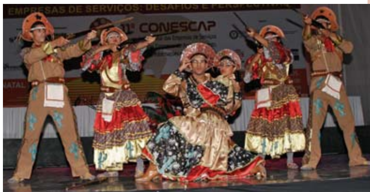
Apresentação do grupo de dança Natal Internacional Show

Antes de iniciar a solenidade, os presentes assistiram à apresentação do vídeo institucional da Fenacon, que mostrou as atividades desenvolvidas pela entidade na atual gestão, e o vídeo com a retrospectiva das dez edições da Conescap, produzido pela Prosoft, empresa patrocinadora de todas as convenções anteriores. ●