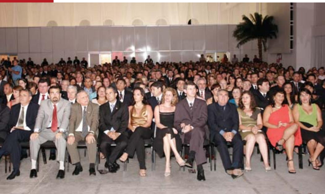
Participantes da 11ª Conescap