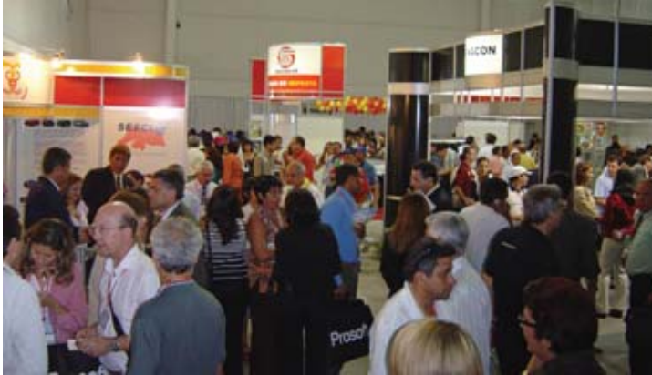
Feira de exposições