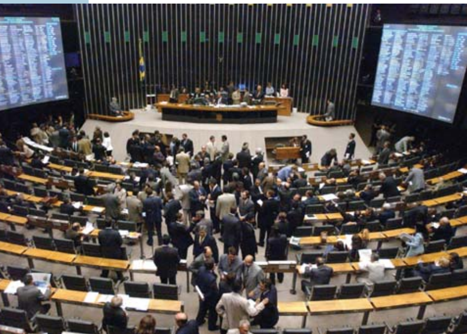
Plenário da Câmara Federal

verno Luiz Inácio Lula da Silva de não subir a carga tributária acima do percentual herdado do governo Fernando Henrique Cardoso. O dado refere-se a tudo o que foi pago de impostos e contribuições aos governos federal, estaduais e municipais.